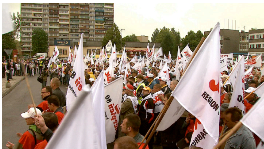
Do pikiety w Sztokholmie NSZZ „Solidarność” przygotowała się bardzo profesjonalnie. Przy wsparciu finansowym central związkowych z innych krajów oraz kolegów walczących o prawa pracownicze w Szwecji wykupiono reklamę w jednym z największych szwedzkich dzienników – „Svenska Dagbladet”.

istniejącego od lat zamrożenia w sferze budżetowej – środki na podwyżki i równanie wskazywanych dysproporcji. W międzyczasie doszło do zmiany rządzących i nowe kierownictwo do wynegocjowanych wcześniej środków dołożyło jeszcze dodatkowe. W 2016 roku pierwszy raz od wielu lat do sądów trafiły środki na podwyżki wynagrodzeń zasadniczych i to aż o 10%. „S” uparła się, że nie ustąpi i będzie korzystała z gwarantowanego przez ustawę o związkach zawodowych prawa do uzgadniania zasad podziału tych środków. Dyrektorzy apelacyjni i pozostali pracodawcy przeżyli niemały szok, że muszą