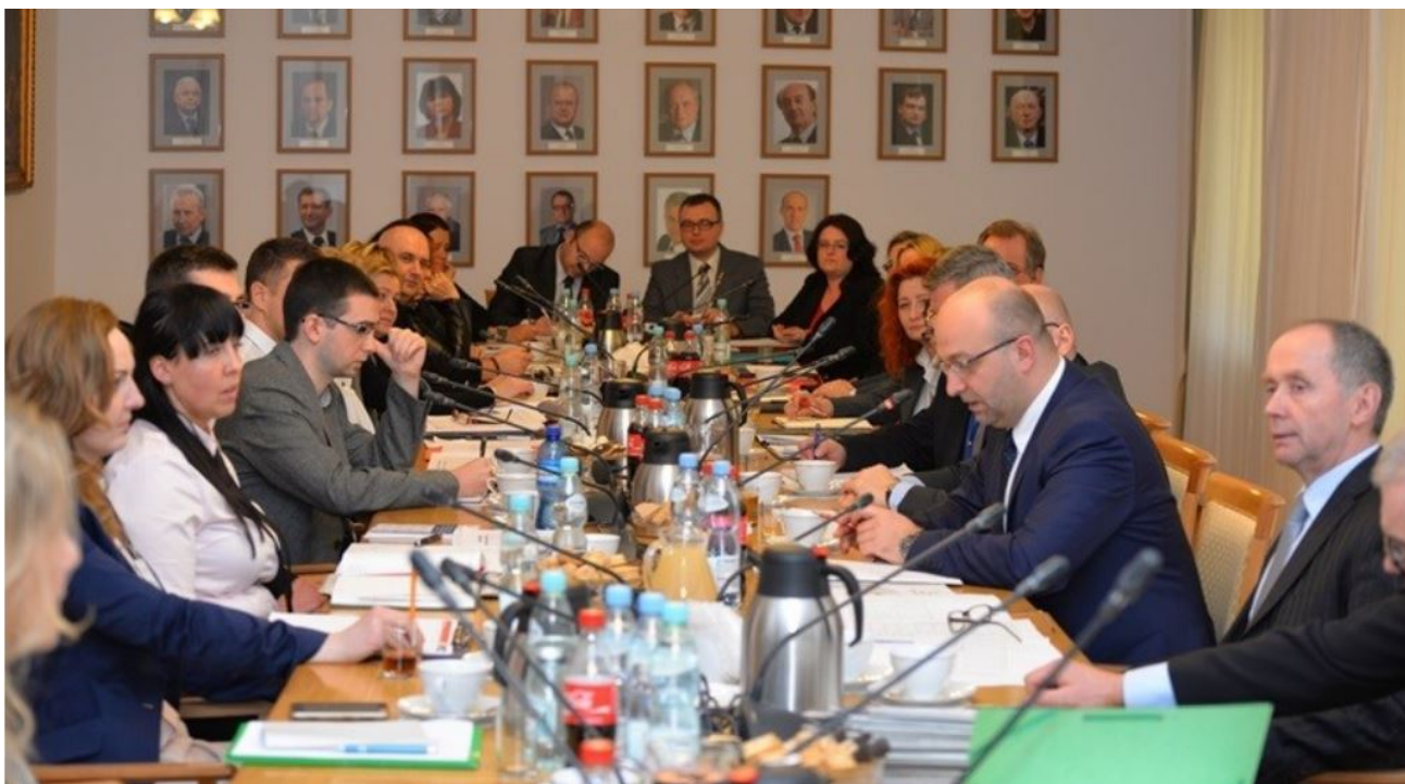
SPOTKANIE W M.S.—16.02.2016 R.—NASI NA PIERWSZYM PLANIE PO LEWEJ